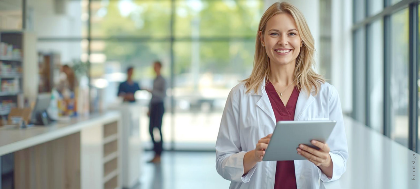
Bild mit KI generiert